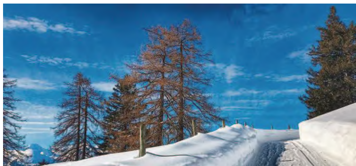
Dieses Foto zeigt ein atemberaubendes Farbenspiel in den verschneiten Bergen.

Wer bereits jetzt die Seite besucht, kann sich durch die Galerie klicken, wird staunen und die schönsten Aufnahmen bewundern. Bisher läuft der Wettbewerb noch. Sobald er aber geschlossen ist, wird das Leser-Voting beginnen. Jeder kann dann seine Likes verteilen und die besten Fotos mit seiner Stimme bewerten. Die drei Fotos, die nach einer Woche die meisten Stimmen bekommen haben, gewinnen einen Gutschein im Wert von 100 Franken. Die Gutscheine werden in diesem Jahr von den Bergbahnen Pizol, Fehr Schuhe + Sport und Chur Bergbahnen zur Verfügung gestellt. Es lohnt sich also, mitzu-